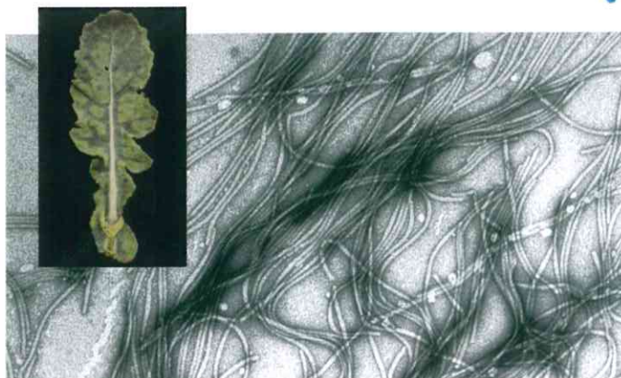
Vláknité částice viru mozaiky vodnice a příznaky infekce na řepce.

Teprve poté začal dramatický rozvoj diagnostiky fytovirů spojený s izolačními technikami či přípravou protilátek. V 70. letech minulého století se přidala i diagnostika viroidů a rutinní testování sadby a osiv. Molekulárněbiologické metody, zejména PCR, dokážou od 90. let minulého století zjistit přímo nukleové kyseliny virů a viroidů a detekovat s řádově vyšší citlivostí viry v přenašečích. Paralelní sekvenování virových genomů – tedy „čtení“ jejich kompletní dědičné informace – v současnosti zcela mění pohled na interakci všech virů s rostlinou.