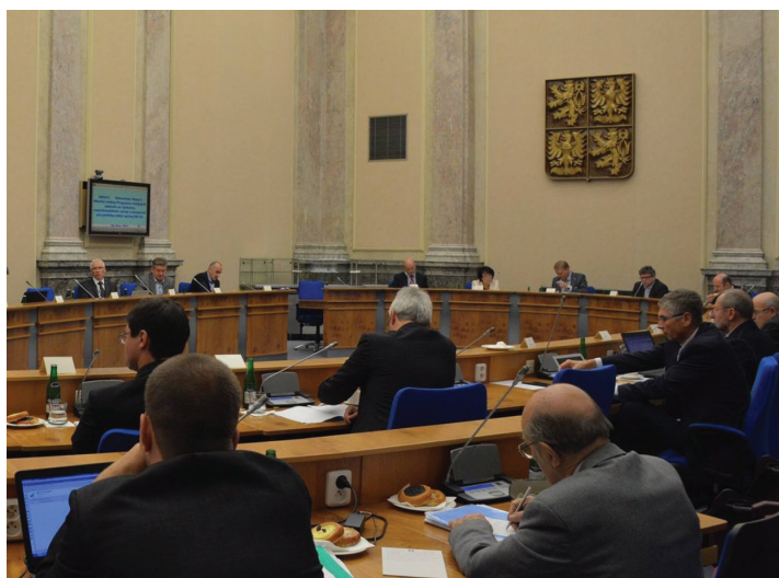
Zasedání Rady pro výzkum, vývoj a inovace dne 30. října 2015

Ohledně přípravy navazujícího programu BETA2 v RVVI panuje jednomyslná shoda korespondující zároveň s požadavky jednotlivých resortů o nutnosti zachování kontinuity mezi oběma diskutovanými programy. Předsedkyně TA ČR na zasedání ujistila RVVI, že již během roku 2016 dojde k vypisování výzev v programu BETA2 , který bude nastaven co nejlépe a jeho podoba bude odrážet zkušenosti z dobré, ale i špatné praxe končícího programu BETA. Kontinuita tak není nikterak ohrožena. RVVI k tomuto programu dále požádala TA ČR o předložení průběžné zprávy o naplňování výzkumných potřeb jednotlivých resortů a dosažených výsledcích v termínu do konce roku 2015. Zároveň se RVVI usnesla na zřízení meziresortní skupiny, která poslouží k výraznému zlepšení komunikace právě při přípravě programu BETA2. ☒